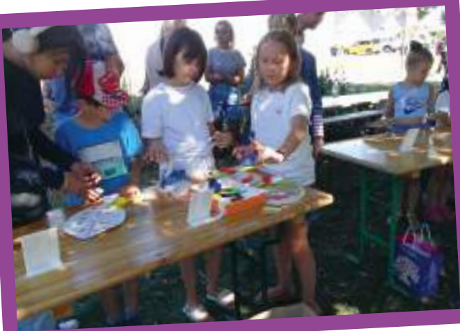
Fabriquer son cerf-volant