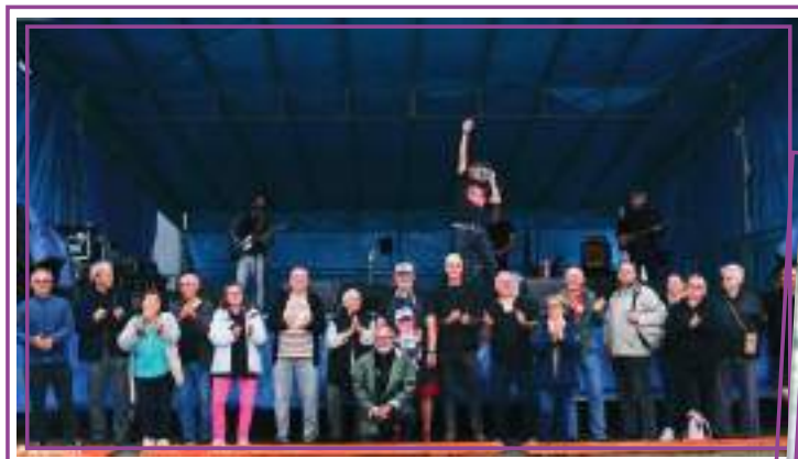
Les bénévoles du Comité des Fêtes