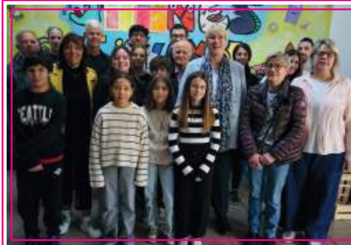
Les membres du CMJ, la municipalité et les parents

Les élections du CMJ (Conseil Municipal Jeunes) ont eu lieu le jeudi 9 octobre, par 150 élèves des classes de CM1 et CM2. Deux nouveaux membres ont été élus. Ils ont ensuite participé à leur journée d'intégration le samedi 11 octobre dernier.