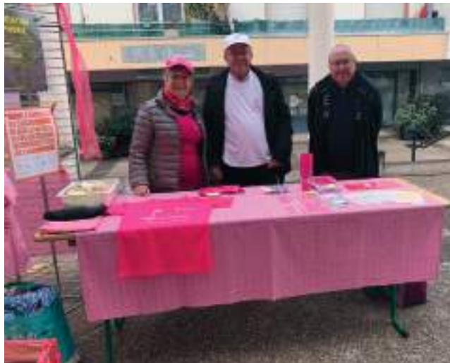
Les bénévoles de l'association Symphonie

Le hall de la mairie était cette année encore décoré et éclairé en rose.