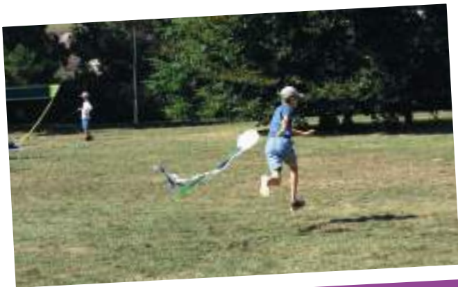
Puis les cerfs-volants s'envolent