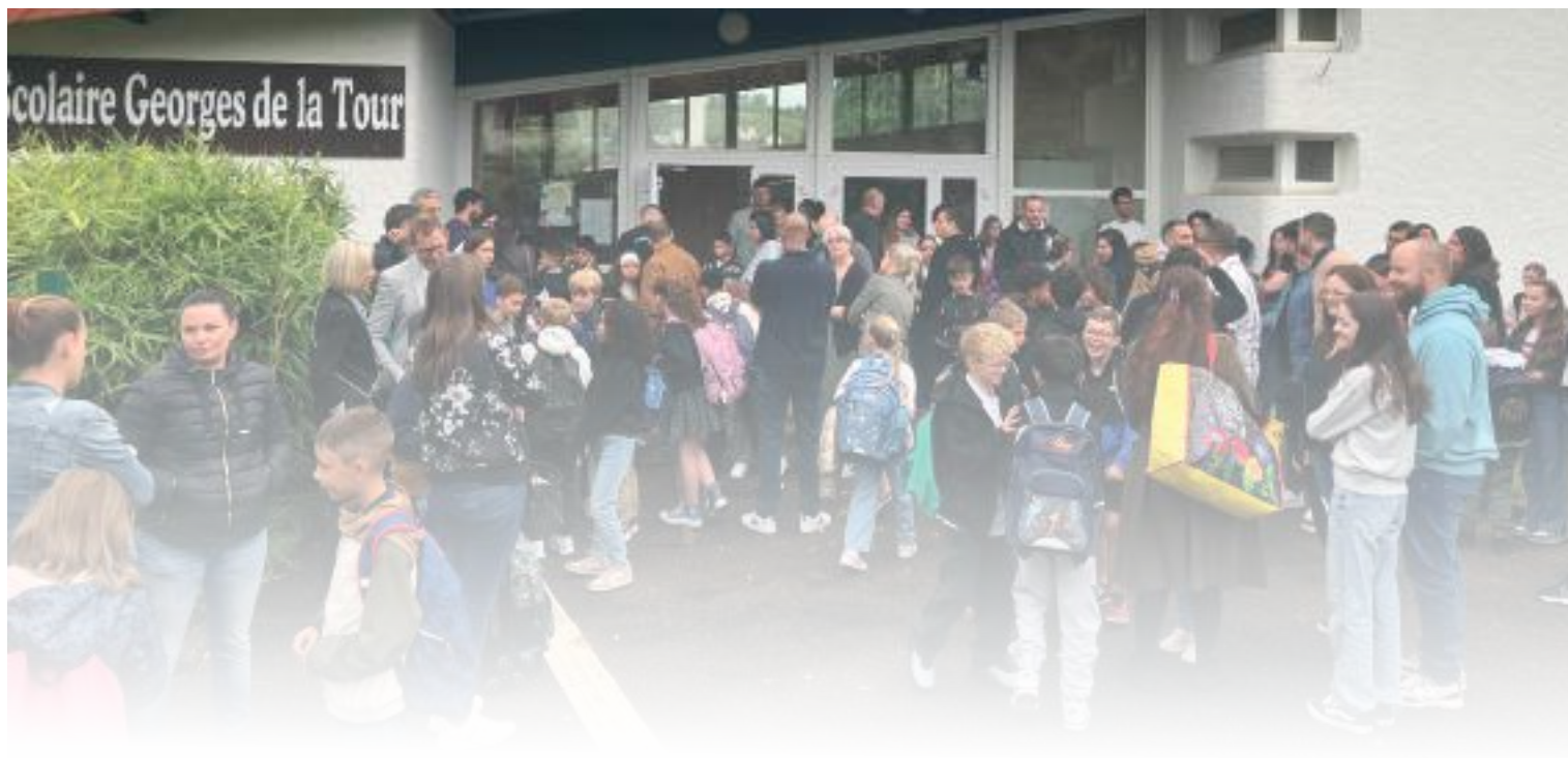
En attendant l'ouverture des portes