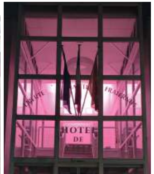
Le hall de l'hôtel de ville éclairé