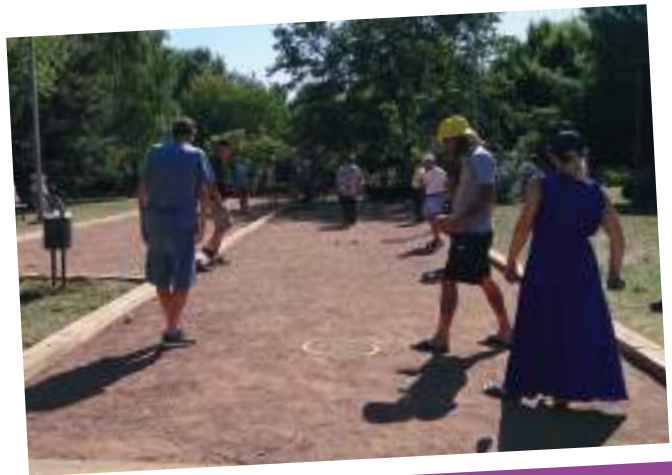
Le concours de pétanque de l'après-midi