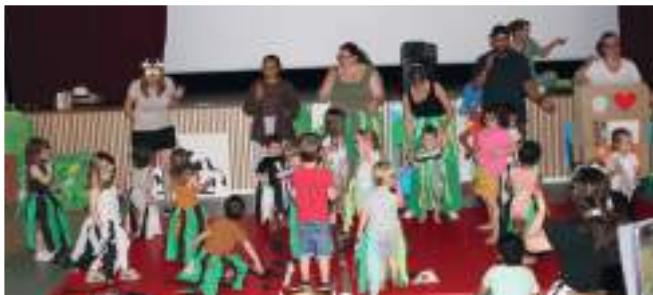
Fête du multi-accueil vendredi 27 juin