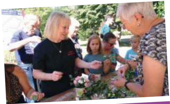
Création de compositions florales