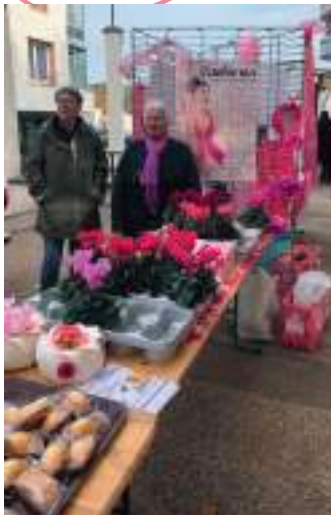
Le stand du comité des fêtes