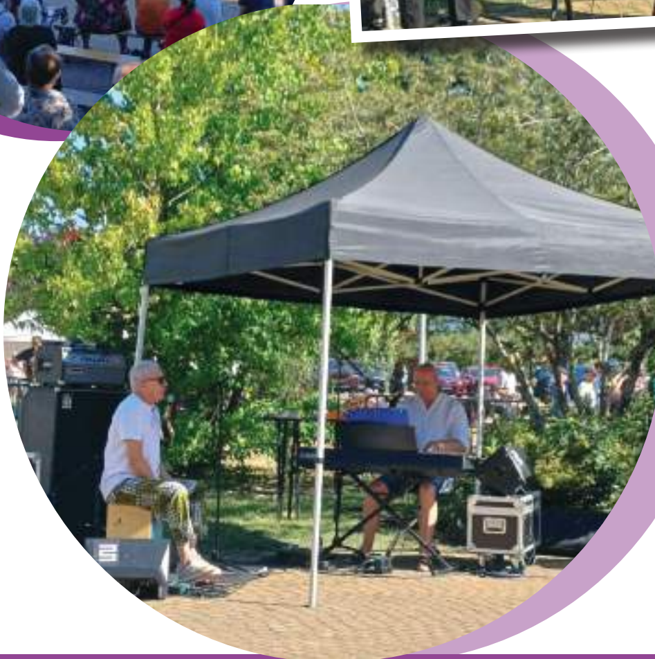
Qban Sound Lab et Cœur Bavard en concert dans l'amphithéâtre rénové du parc Schuman