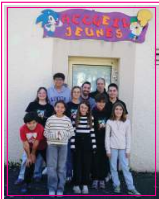
Les membres du CMJ et les animateurs de l'Accueil Jeunes