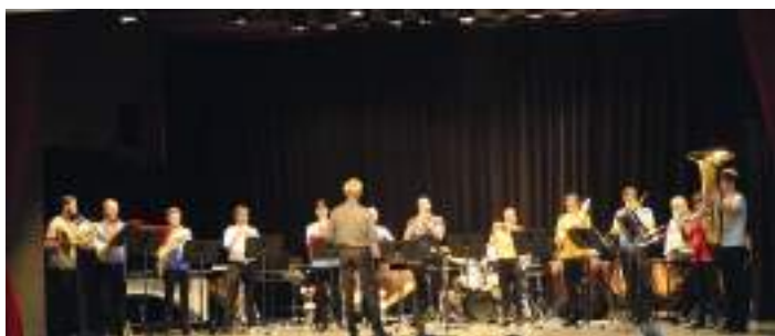
Concert offert par la municipalité aux classes de CP, CE1 et CE2 ainsi qu'aux personnes âgées

Un concert qui a fait du bruit... et de la magie ! Les cuivres et les percussions de l'Orchestre de l'Opéra national de Nancy-Lorraine sont montés sur scène pour un concert plein d'énergie et de surprises !