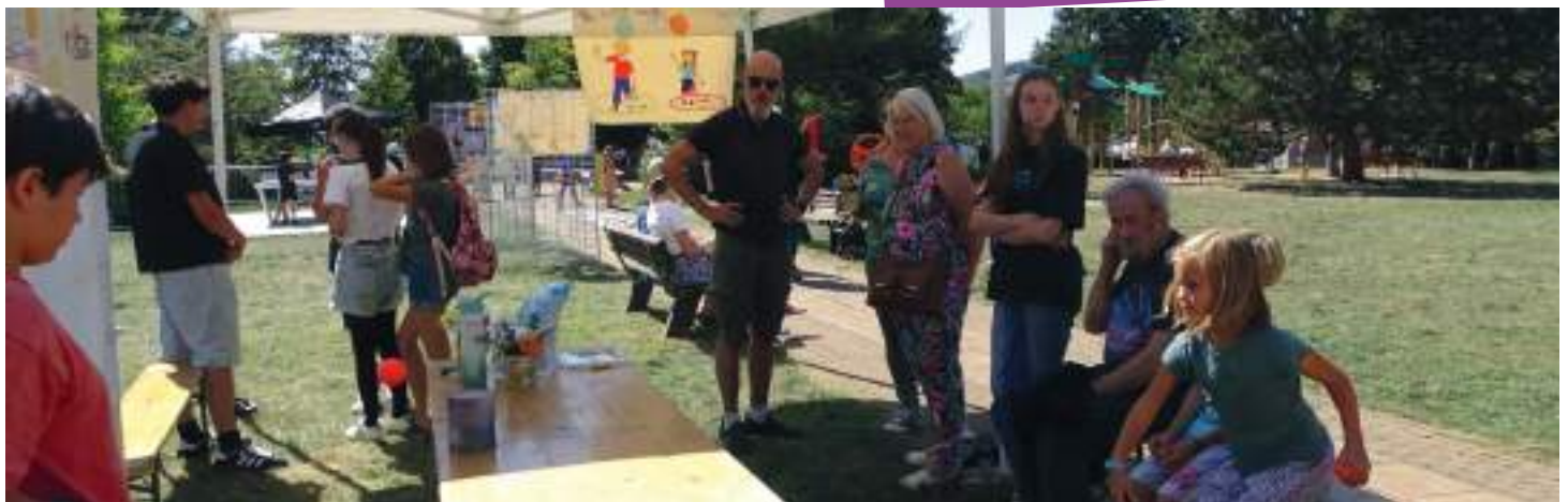
Jeux de kermesse