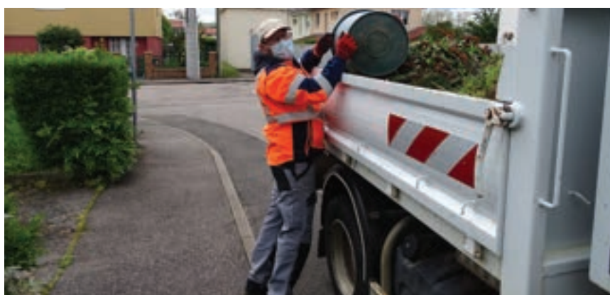
Ramassage des déchets verts