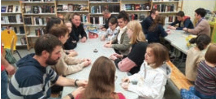
Soirée jeux le 30 septembre à la médiathèque