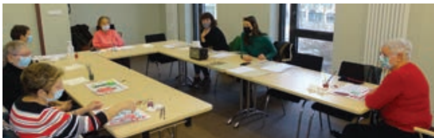
Atelier Sentier de la créativité