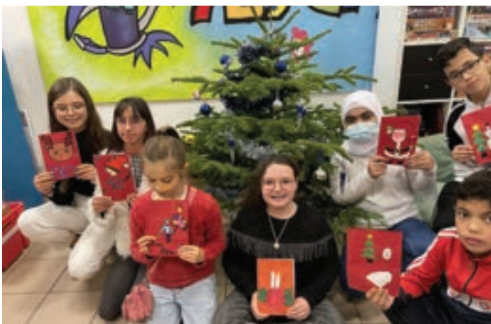
Noël tous ensemble pendant les vacances