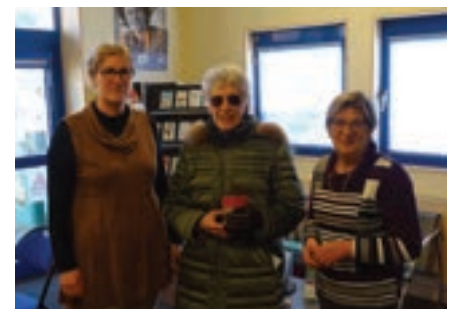
Distribution de chocolats aux plus de 80 ans