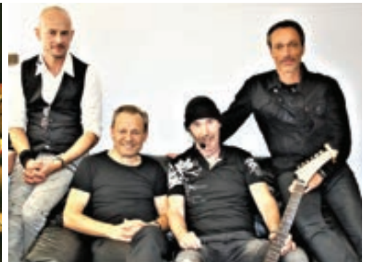
Le Tribute U2 a investi la scène en interprétant les tubes du célèbre groupe irlandais U2. Ils ont repris tous leurs grands standards pour le plus grand bonheur des spectateurs

Dans la continuité du festival de théâtre revisité avec une programmation étalée sur l'année entière, les Seichanais ont assisté à plusieurs pièces :