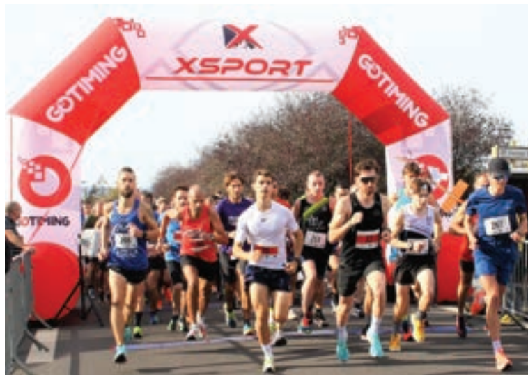
Départ 5 et 10 km

Le dimanche 30 octobre 2022 après un an de travail, la nouvelle manifestation sportive de la Ville « Les Boucles Seichanaises » a vu le jour pour sa 1 ère édition.