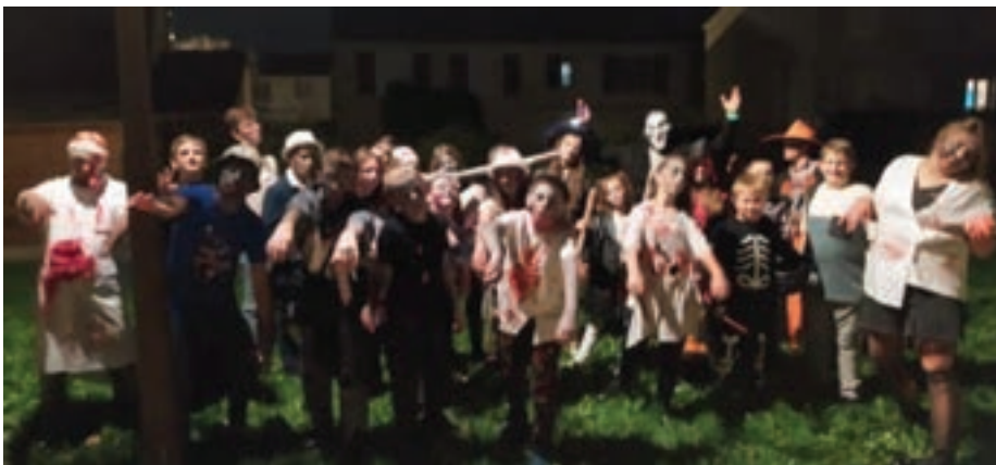
Zombie-walk pendant les vacances d'automne