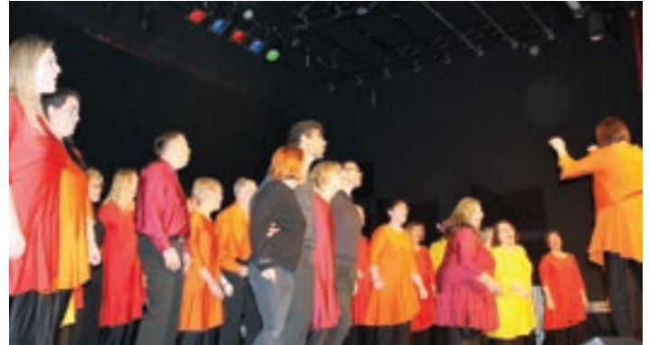
Les chorales AUX QUATRE VENTS et IMPUL'SON ont offert une soirée de chant choral, en remerciement pour le prêt d'une salle de répétition du socioculturel par la commune