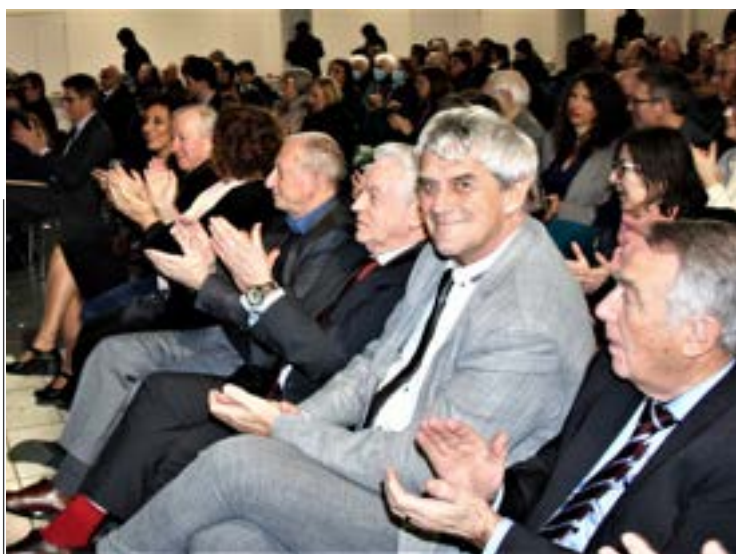
Des élus présents à Seichamps

Pour retrouver l'intégralité du discours des vœux, www.mairie-seichamps.fr/ La ville/Cérémonie des vœux du maire