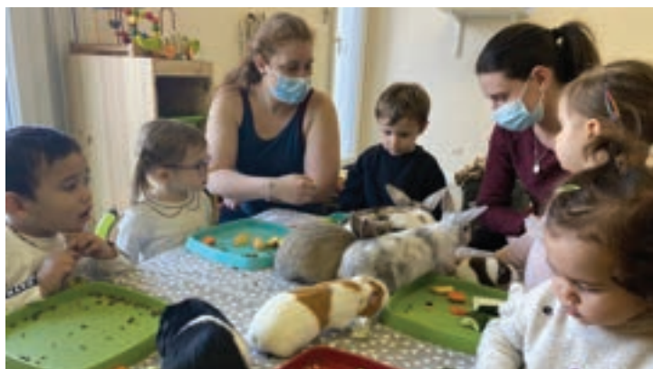
Activités de médiation animale au RPE