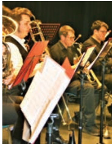
Concert du Nouvel An de l' Harmonie Nancéienne