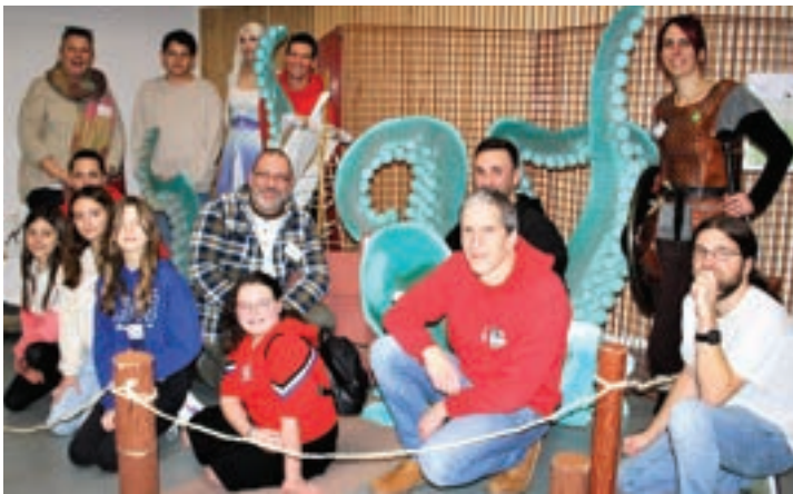
Fête du jeu le 3 décembre au centre socioculturel