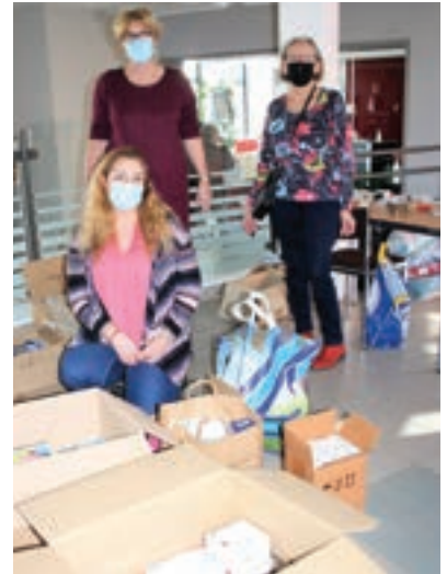
Collecte Solidarité Ukraine