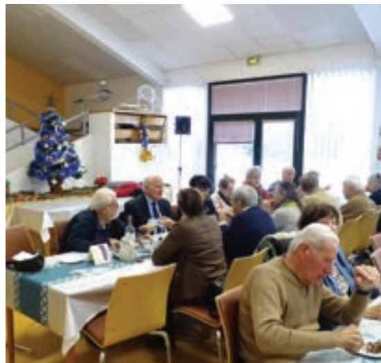
Repas à thème à la Maison de l'Amitié