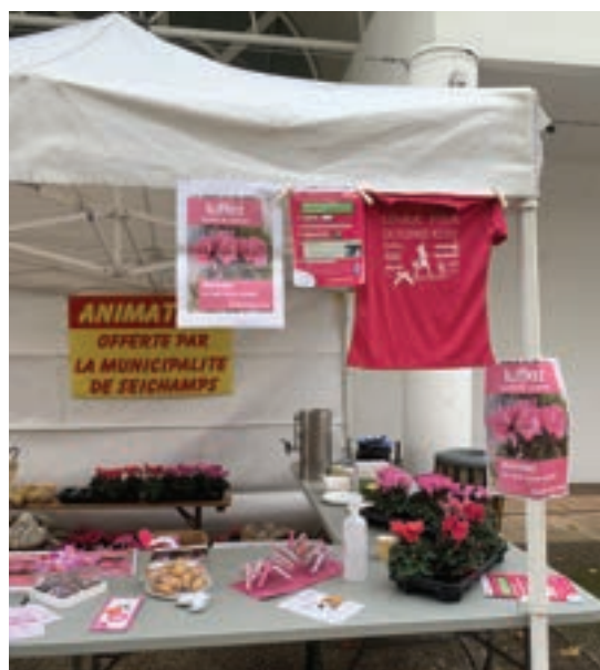
Octobre rose sur le marché