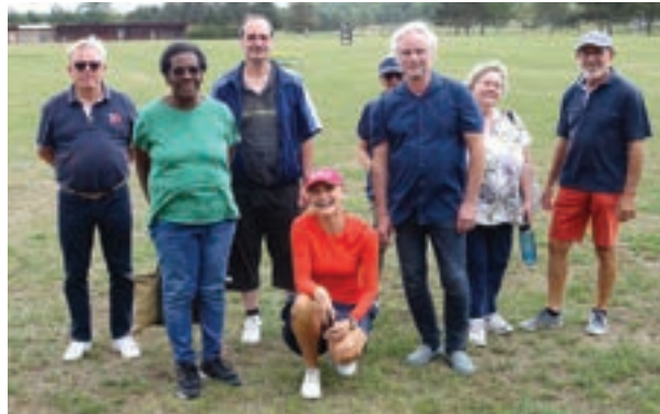
Heure du Tee

Cette plaquette est disponible en mairie