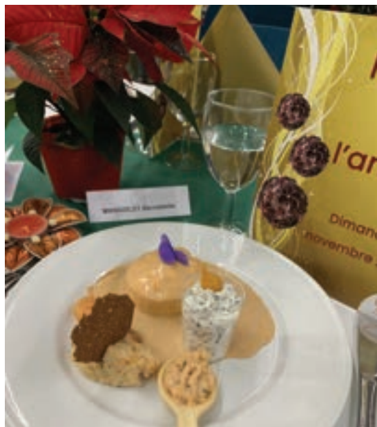
Repas de l'Amitié offert aux plus de 67 ans