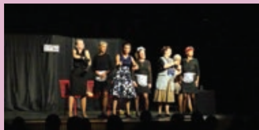
Les filles de Simone par la compagnie Incognito décrivant avec humour l'évolution des femmes depuis les années 50